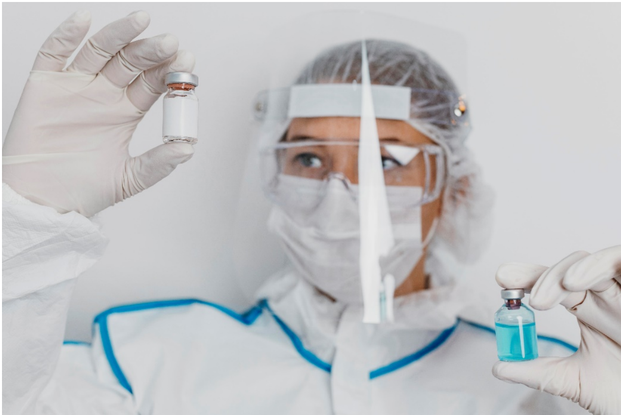
Figura 3 - Biossegurança laboratorial

Para garantir a segurança, os laboratórios NB-4 contam com sistemas de ventilação em pressão negativa, filtragem de ar por HEPA, acesso controlado por câmaras de segurança e a exigência de que os profissionais utilizem trajes de pressão positiva com fornecimento independente de ar (Delves, 2018).