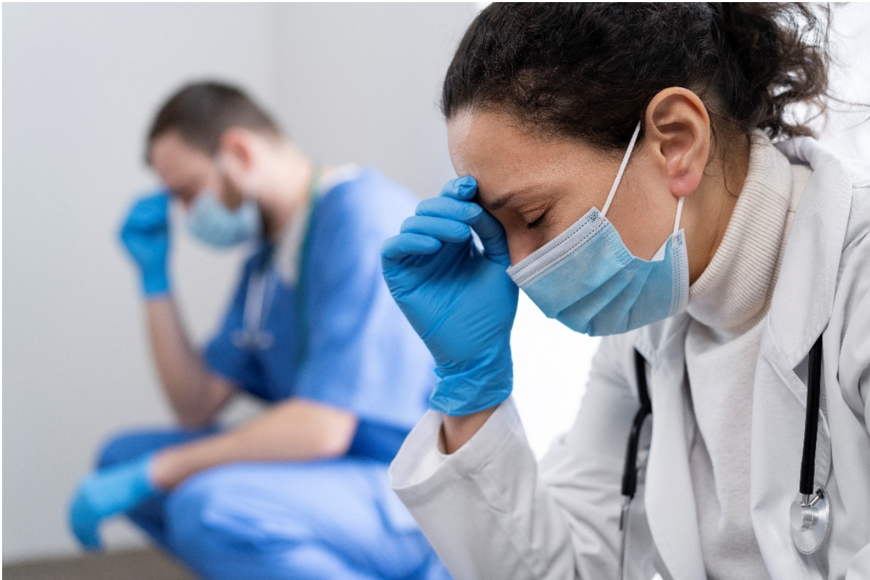
Figura 4 - Preocupação com acidentes

Os acidentes de laboratório constituem um dos maiores desafios no campo da biossegurança. Eles podem ocorrer em situações rotineiras e resultar em riscos ocupacionais e impactos ambientais.